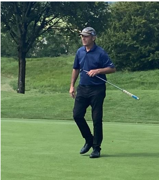
1. Turnier von Jürg Nussbaum bei den Senioren