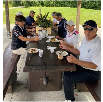
Die Pause tut allen gut